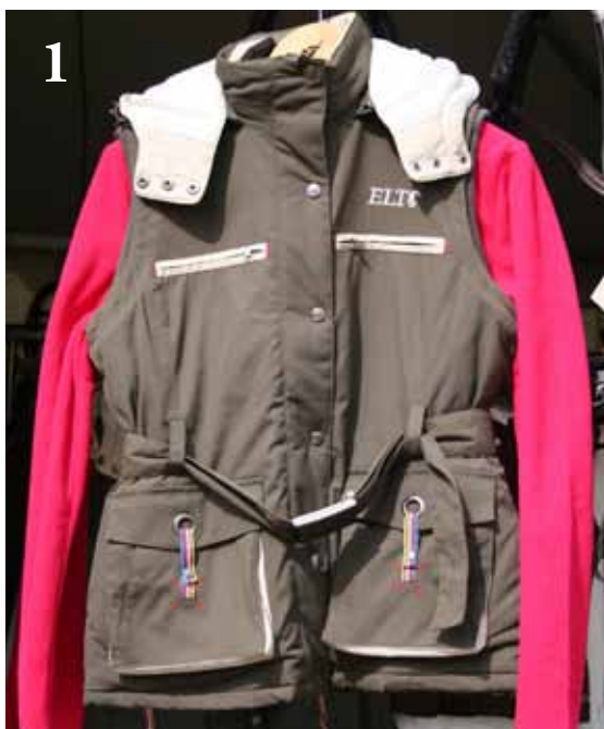
La Grange (De gauche à droite et de haut en bas)

Photo 1: Veste sans manche ELT Sabrina 62€